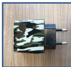
Image de l'article. Sample picture of the item.

L'objet décrit est conforme à la législation d'harmonisation de l'Union pertinente: The described object of the declaration is in conformity with the relevant Union harmonisation legislation: