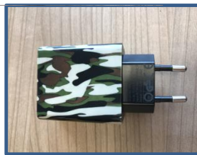
Foto del prodotto Picture of the item

L'oggetto descritto è conforme alla pertinente normativa di armonizzazione dell'Unione: The described object of the declaration is in conformity with the relevant Union harmonisation legislation: